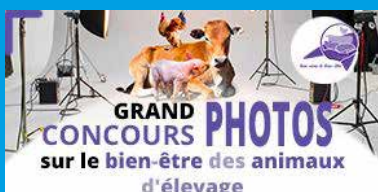
Photo Exhibition #Becose : discover the 20 winning photos of the farm animal welfare competition! See them between halls 2 and 3